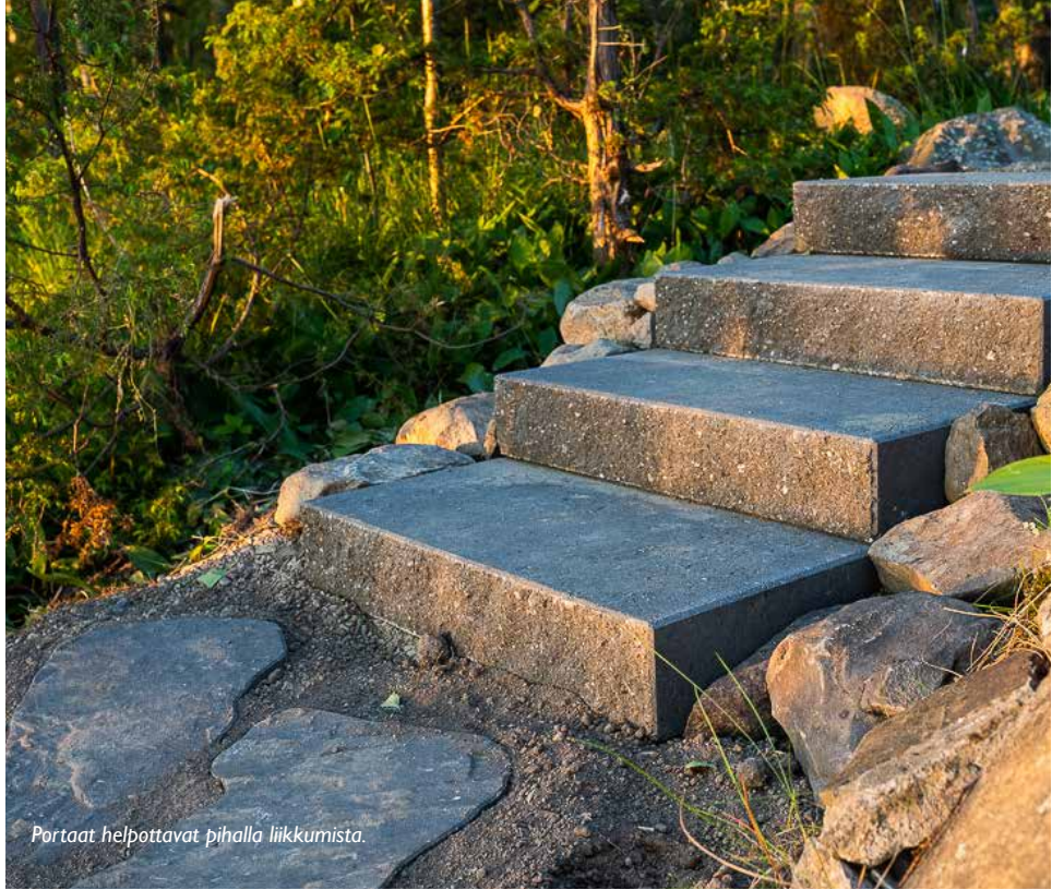
Portaat helpottavat pihalla liikkumista.

Lisätietoja ja vinkkejä saat Pihakivi.com -sivustolta. Sivustolta ladattavissa olevista oppaista ja asennusohjeista saat yksityiskohtaista tietoa ja ohjeita pihakiveyksen suunnittelusta ja rakentamisesta.