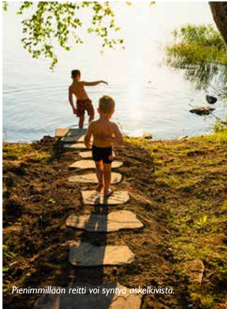
Pienimmillään reitti voi syntyä askelkivistä.