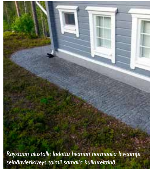
Räystään alustalle ladottu hieman normaalia leveämpi seinänvierikiveys toimii samalla kulkureittinä.