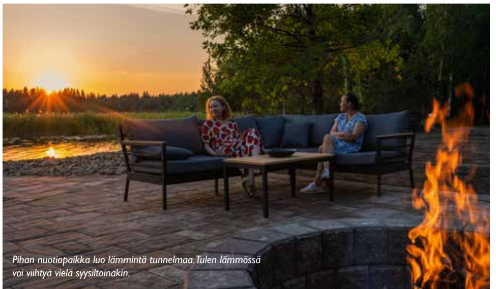
Pihan nuotiopaikka luo lämmintä tunnelmaa. Tulen lämmössä voi viihtyä vielä syysiltoinkin.