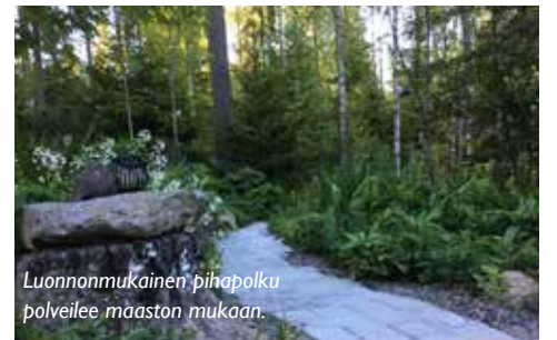
Luonnonmukainen pihapolku polveilee maaston mukaan.