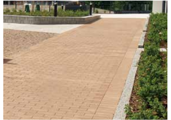
Värisävyytä on monia. Hae pihaasi sopivin väri talon sävyistä, katosta tai sokkelista. Kuvassa väri hiekanruskea.