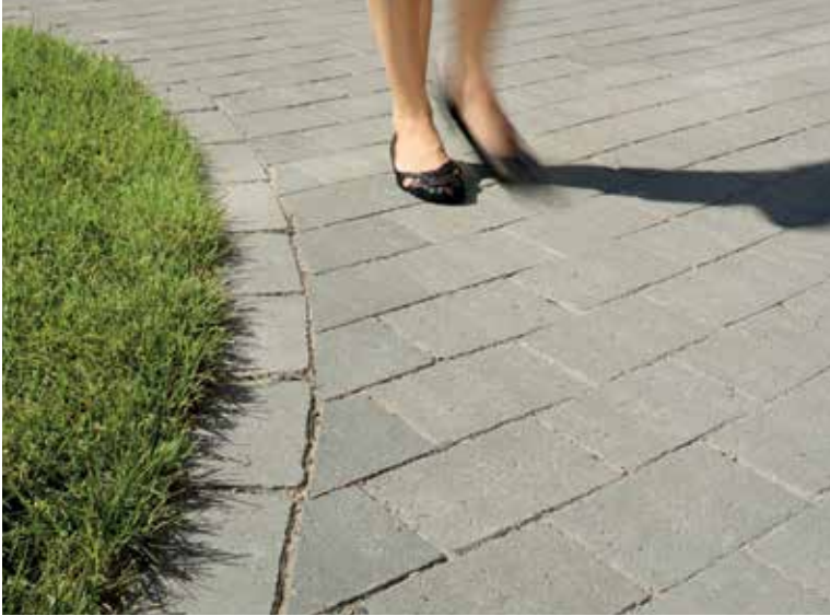
Luonnollista, rentoa tunnelmaa saat patinoiduilla kivillä. Kuvassa patinoitu harmaa Kartanonupu.

Perus Kartanokivi on kooltaan 278x138 mm. Kartanokivet ovat neliön tai suorakaiteen mallisia, 60 mm tai 80 mm paksuja betonikiviä. Valittavana olevat pintakäsittelyvaihtoehdot ovat sileää (S), hiekkapuhallettu (HP) ja hienopesty (HN). Kartanokiviä valmistetaan myös viistettöminä ja patinoituina. Kartanokivisarjaan on saatavissa valokivi-valaisin, joka voidaan upottaa kiveykseen.