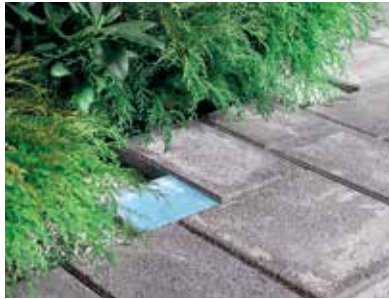
Valokivillä luot tunnelmaa ja ohjaat kulkua hämärän aikaan.

Kiveyksen reunassa käytetään aina kokonaista kiveä ns. juoksukiveä.